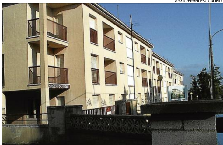
La caserna de la Guàrdia Civil és un dels projectes investigats

Un dels nuclis centrals del procés d'instrucció és l'empresa mu-