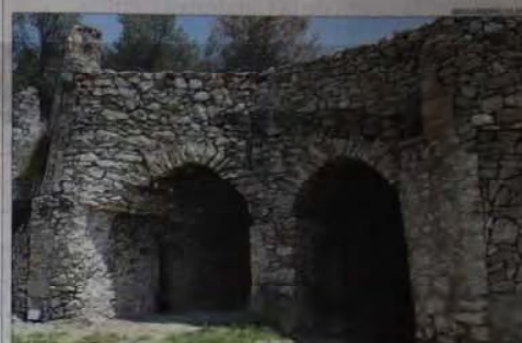
El Forn de Calç de Calders, un dels elements destacats del patrimoni del Moianès