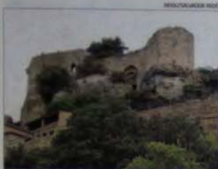
GRANERA El castell ► La primera referència històrica és de l'any 971. Integrat al circuit de Moiana, està construït amb parament de pedra de gran qualitat, i conserva intacte tot el recinte de mur.