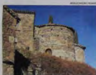
SANTA MARIA D'OLÍ El patrimoni romànic ► El terme d'Olí és ple d'esglésies i capelles d'estil romànic. En destaca Sant Feliet de Terrassola (1927), restaurada el 1970. Consta de dues naus amb dos absis i una torre que fa les funcions de campanar. A prop del mas d'Armenteres hi ha les ruïnes de Sant Joan Vell (1308). També destaquen les esglésies de Sant Vicenç de Vilarrasau i de Sant Joan de Vilanova.