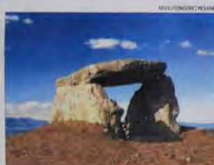
MONISTROL DE CALDERS Dolmen del Pla de Trulla ► Data de l'edat del bronze (entre els anys 1800 i 700 aC). És un sepulcre megalític, de cambra simple. Va ser restaurat el 2005 i integra la ruta de la pedra seca. Té una caixa de planta rectangular i amb grans lloses falcades a terra, amb una altra a sobre com a coberta de la cambra sepulcral, el lloc d'enterrament.