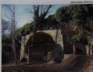
CASTELLERÇOL El Roquer ► Del segle XVII, és una bellíssima construcció feta amb pedra amb volta de mig punt, amb dovelles de pedra picada que formen un arc. Aquesta volta dona peu a una altra volta d'uns deu metres de fondària que va a morir al fons d'una bauma natural. A dins, hi ha una taula llarga de pedra. Darrere, hi ha un llarg pedrís de pedra, per on passava l'aigua, i que s'utilitzava com a safareig.