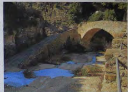
Pont del Hossinyot, a Sant Quirze Safaja

L'economia de petita escala, per tant, la