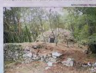
POUA DE LES TORRES ► De dimensions mitjanes, està en bon estat. El parament de tota la poua és de pedra i té dues boques. Es conserva un mur de contenció de la rampa d'accés a una de les boques.