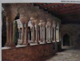
L'ESTANY Monestir de Santa Maria de l'Estany ► Datat entre els segles XI i XII, és un dels monuments insígnies del romànic català. L'església guarda encara l'estil romànic primitiu impressionat per la seva austeritat, tota de pedra nua i aspra. El claustre és una visita obligada per als amants del romànic. És gairebé quadrat, i en destaquen les columnes dobles amb els seus 72 capitells, esculpits amb tot tipus de figures i d'escenes.