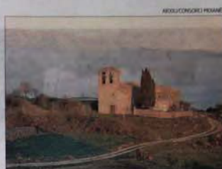
COLLUSPINA Església de Sant Cugat de Gavadons ► Té més de mil anys d'història, i ja és citada l'any 968. L'església actual és del segle XII, i ha registrat moltes modificacions. La més important, la supressió de l'absis per un presbiteri més gran.