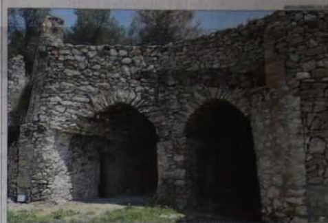
El Forn de Calç de Calders, un dels elements destacats del patrimoni del Moianès

► De dimensions milianes, està en bon estat. El parament de tota la poua és de pedra i té dues boques. Es conserva un mur de contenedori de la rampa d'accés a una de les boques.