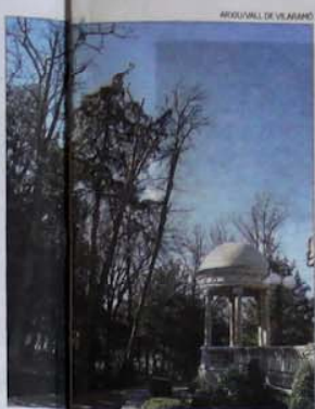
ARQUILL DE VILARRO

► Datat entre els segles XI i XII, és un dels monuments insinys del romànic català. L'església guarda encara l'estil romànic primitiu impressiona per la seva austeritat, tota de pedra nua i aspra. El claustre és una visita obligada per als amants del romànic. És gairebé quadrat, i en destaquen les columnes dobles amb els seus 72 capitells, esculpits amb tot tipus de figures i d'escenes.