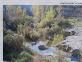
CALDERS Font de les Tàpies ► Fondida a sota d'un salt d'aigua força important. Tradicionalment, els ramats d'ovelles s'abouraven en aquest indret. L'aigua ha estat canalitzada i embotada des d'abans del segle XIX.