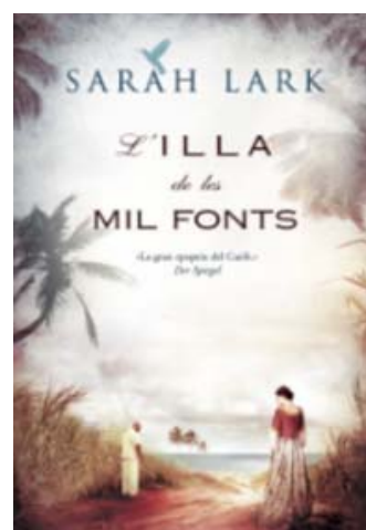
L'illa de les mil fonts de Sarah Lark