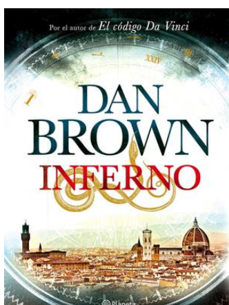
Inferno de Dan BROWN