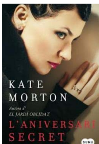
L'aniversari secret de Kate Morton